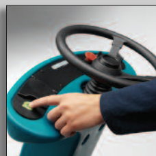
Rengöring med en knapptryckning