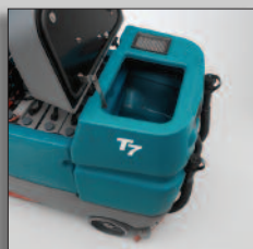
Tankar som lätt kan rengöras