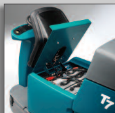
Batteripaket som räcker länge