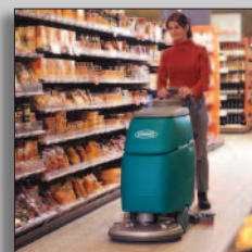
Maskinen i drift