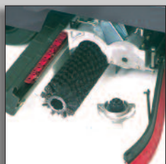
Inga verktyg för borst och sugbladsbyte