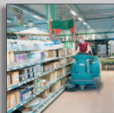
Maskinen i drift