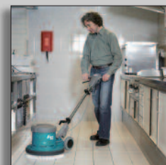
Maskinen i drift