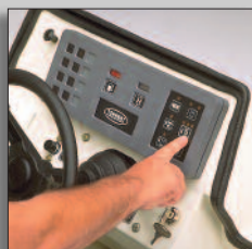
Körs utan ansträngning