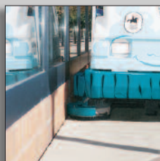
Sidoskurenhet som standard