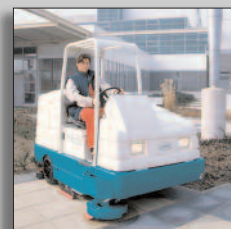
Maskinen i drift